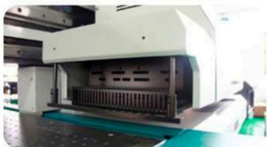
Nueva Generacion de Sensor de Golpes, el cual ofrece una proteccion mayor a los cabezales durante el movimiento