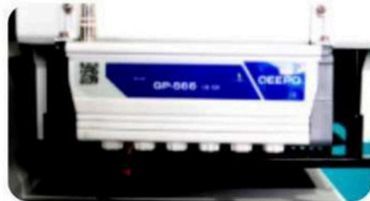
Equipado con un nuevo sistema Anti-estatica, el cual evita cualquier imperfección causada por la estatica de los materiales, asegurando una impresión de calidad