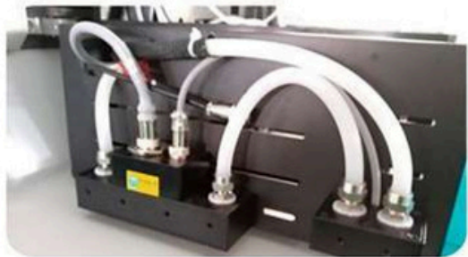
Sistema de Secado Led enfriado por agua, el cual es mucho mas eficiente y duradero, bajo consumo electrico y amigable con el medio ambiente