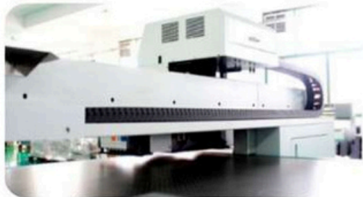
Cadena de construcción alemana utilizada para mantener los tubos y cables protegidos de una excelente manera