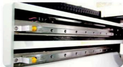
Sistema Dual de rieles THK, el cual entrega velocidad y baja emision de ruido, mas estabilidad durante los procesos de movimiento, dando una mayor precision