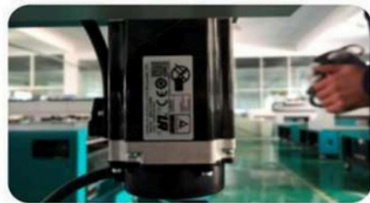
Sistema de movimiento por Motores Japoneses Fuji, de una calidad superior que asegura un funcionamiento y calidad optima